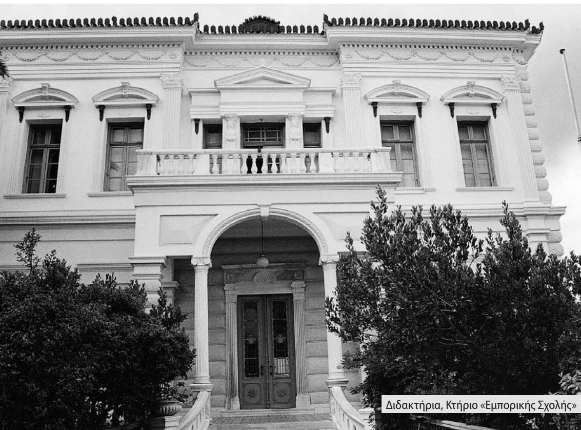
Διδακτήρια, Κτήριο «Εμπορικής Σχολής»